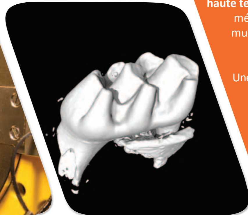
Molaire de souris imagée en 3D avec une résolution de 710 nm